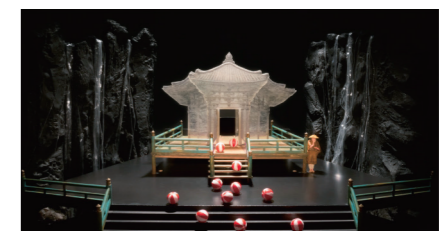
中島みゆき「夜会VOL.15～夜物語～元祖・今晩屋」(赤坂ACTシアター 2008)

日本を代表する舞台美術家・堀尾幸男氏が手がけてきた、オペラ・演劇・歌舞伎など600を超える演目から厳選した27作品の模型を中心に、スケッチや図面、実際に舞台上で使用した小道具を展示します。(中断期間あり)