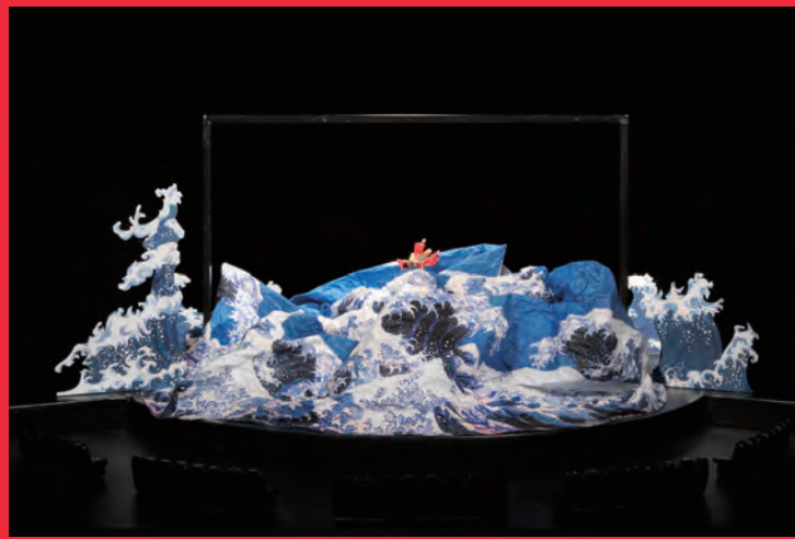
劇団☆新感線 RX 五右衛門ロック (演出：いのうえひでのり / 2008)

「さまよえるオランダ人」など、演出上の動きを想定したギミック(しかけ)が 組み込まれた模型も展示。実際に展示会場内で動きます。