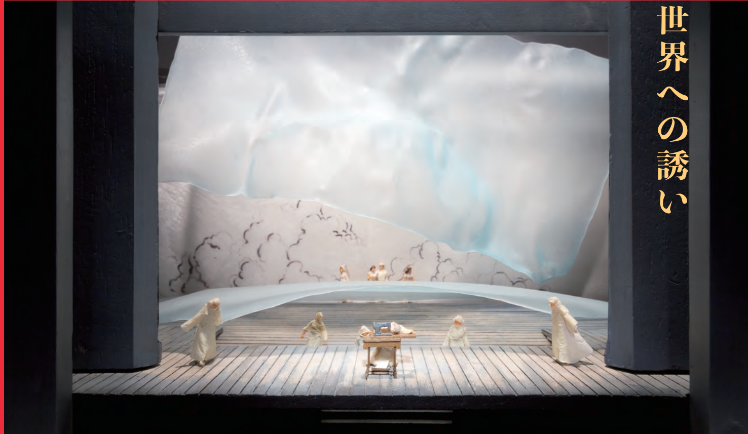
NODA・MAP 第1回公演「キル」(演出：野田秀樹 / 1994)

模型以外にも、公演に関連する小道具、脚本、図面、舞台写真などもあわせて展示します。