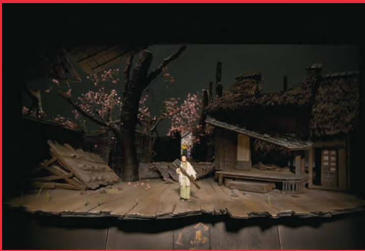
彦馬がゆく (演出：三谷幸喜 / 2002)