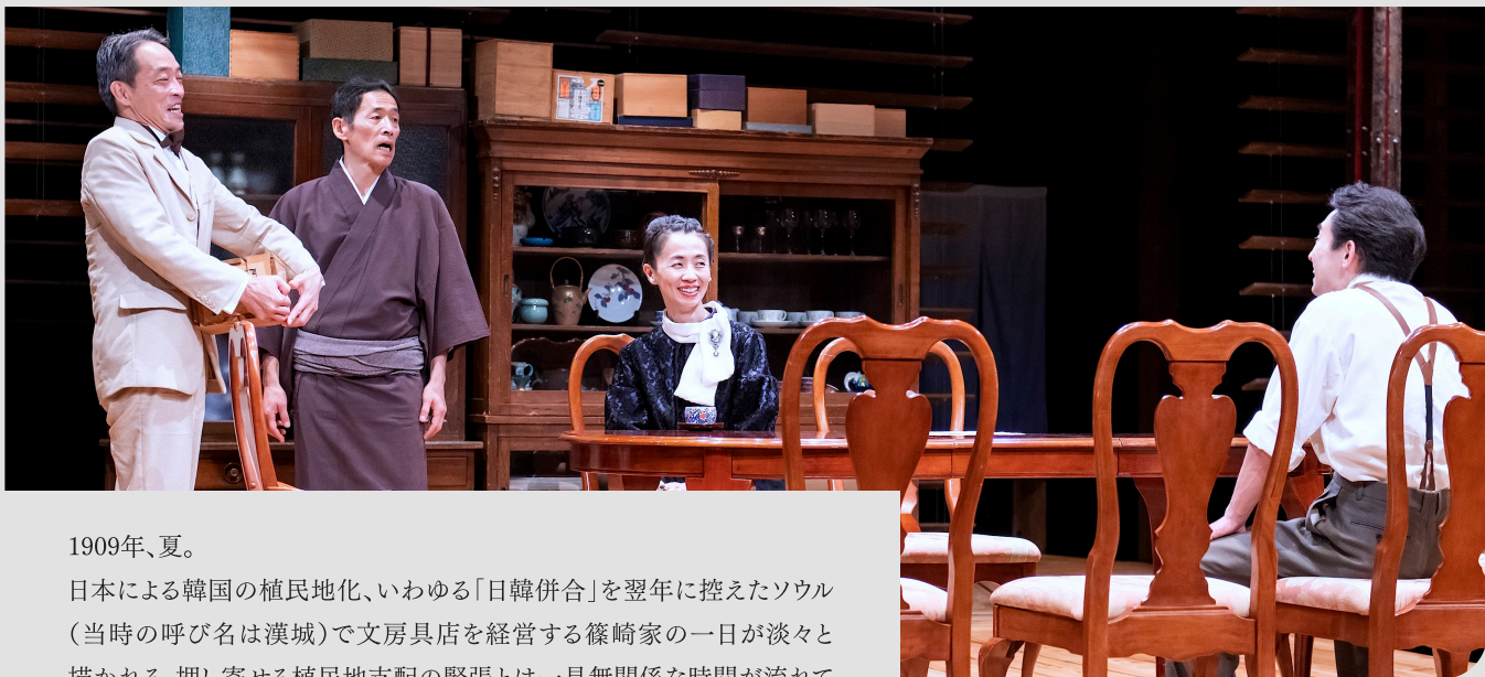
江原河畔劇場公演(2022年)より