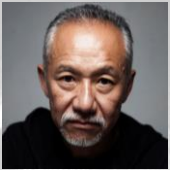
山岸刑事役 室山和廣 (声の出演)