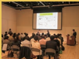
▲昨年度のセミナーの様子