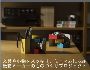
文具や小物をスッキリ、ミニマムに収納！ 紙箱メーカーのものづくりプロジェクト！

「札幌スタイル」とは 札幌で生まれた、高い品質と オリジナリティを持つ製品を 札幌市が認証する地域ブランド。 百貨店や雪まつりなどへの 出展のほか、様々な企業・団体 とのネットワークを構築し、 販路拡大や新たな製品づくりに 取り組む。