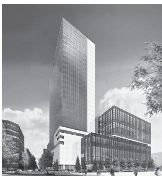
札幌市民交流プラザ(建物右側)外観

札幌市民交流プラザは、2018年10月、札幌都心に誕生する新しい施設です。札幌文化芸術劇場、札幌文化芸術交流センター、札幌図書・情報館からなり、札幌における多様な文化芸術活動の中心的な拠点となることを目指します。隣接する高層棟には放送局やオフィスが入居するほか、地下には駐車場や公共駐輪場などが整備されます。詳しい情報は、札幌市民交流プラザHPをご覧ください。