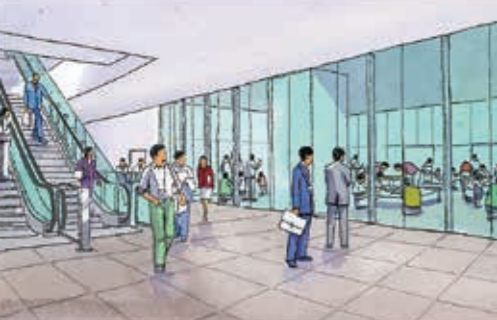
※画像はイメージ図です。実際とは異なる場合がございます。